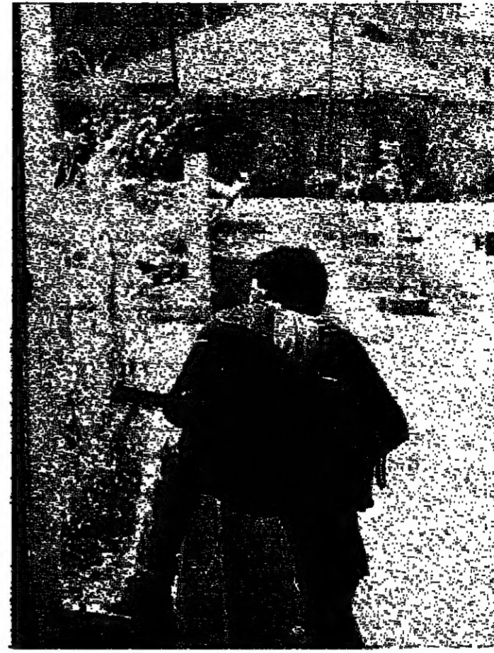
مسرح في احد شوارع طرابلس امس